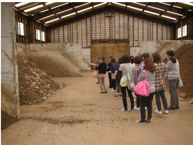
エコタウン第二工場見学